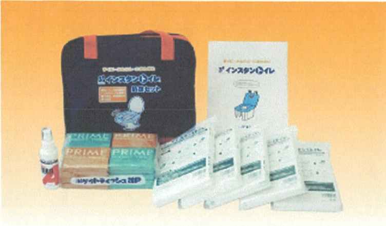
インスタントトイレ マイバッグ 小 (約3日分セット)