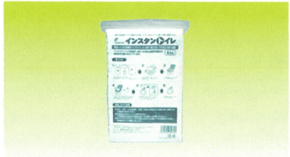
インスタントトイレ 4回分

断水時に自宅の様式トイレで使用します。 排泄物の処理セットに臭いの分子をほぼ100% 閉じ込め可能なポリブチレン製フィルムを使用 使用後の臭いと菌を約2週間閉じ込めます。 1回の使用量に対し約1.5倍の吸水能力 吸水シートなので、使用時の消音効果大