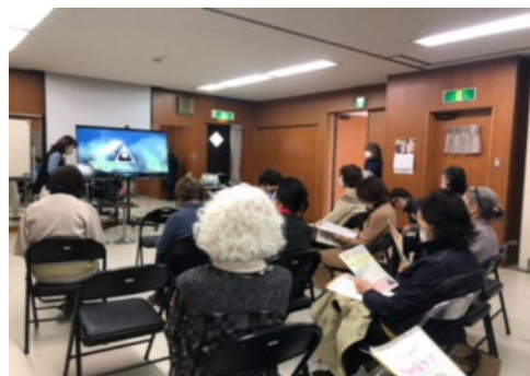
いきいきサロン 2月27日（火） 認知症を正しく理解して学ぼう